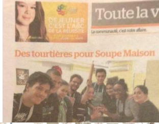
Œuvre Soupe Maison de Lachine 08/12/15