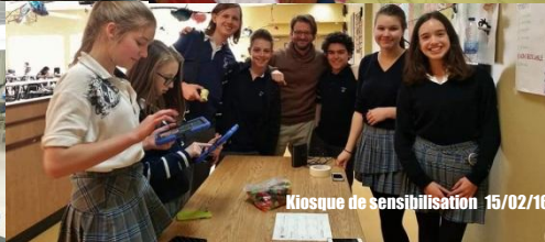
Kiosque de sensibilisation 15/02/16