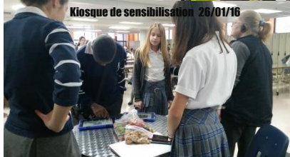
Kiosque de sensibilisation 26/01/16